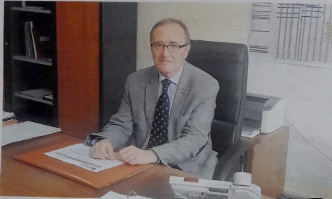
La asociación funciona en Córdoba desde 2005 como apoyo a familias

ABC y la obra social La Caixa pretenden mostrar en esta página la faceta más solidaria de Córdoba, dando voz a las asociaciones y fundaciones que desempeñan una labor altruista para ayudar a los demás